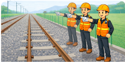
지적확인 환호응답 후 선로 횡단