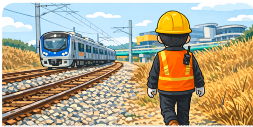
건축한계 바깥 또는 노반으로 이동