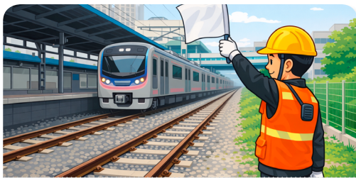
안전한 장소에서 열차감시